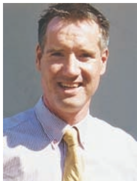
Von Michael Hauke

Was wissen wir über die Wirksamkeit der Impfung?