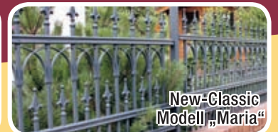
New-Classic Modell „Maria“