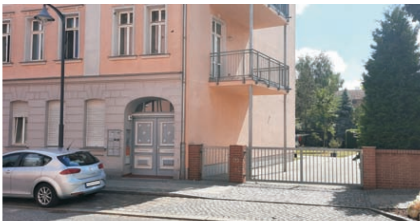
In diesem Hof in der Gartenstraße in Fürstenwalde-Mitte wurde ein Toter mit massiven Verletzungen aufgefunden. Die Obduktion ergab keine Fremdeinwirkung.

In dem Falle des mit massiven Verletzungen in der Fürstenwalder Gartenstraße aufgefundenen Toten schließt die Polizei ein Fremdverschulden aus. In den frühen Morgenstunden des 25. Juli war in einem Hinterhof in der Gartenstraße in direkter Nähe zur Trianonstraße eine männliche Leiche gefunden worden. Die Polizei wurde um 6.05 Uhr alarmiert. Nach Erkenntnissen der Beamten handelt es sich um einen 43-Jährigen. Die Mordkommission der Polizeidirektion Ost nahm die Ermittlungen