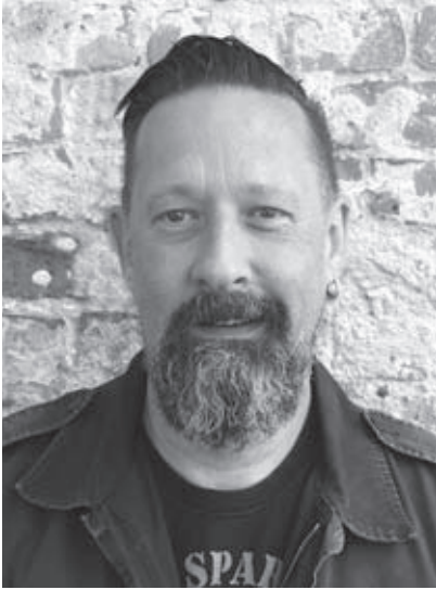
von Jan Knaupp

Wenn Sie denken, ich schreibe heute etwas über die aktuellen Trendthemen wie Affenpocken, Antisemitismus auf der Documenta oder Russlands gedrosselte Gaslieferungen, dann haben Sie falsch gedacht. Als ob es keine anderen Themen gäbe. Obwohl – ich bin schon erstaunt, wie sehr sich unser Wirtschaftsminister Habeck über Russlands Reduzierung der Gaslieferung empört. Dabei war er es doch, der bereits im März dieses Jahres angekündigt, dass er die russischen Öl- und Gasimporte stark reduzieren wolle. Außenministerin Baerbock propagierte im April, während ihres Besuches im Baltikum, sogar: „Deshalb sage ich hier klar und deutlich: Ja, auch