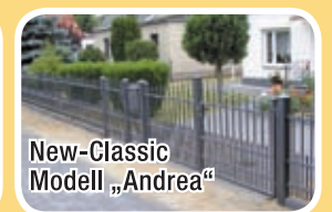
New-Classic Modell „Andrea“