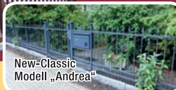
New-Classic Modell „Andrea“