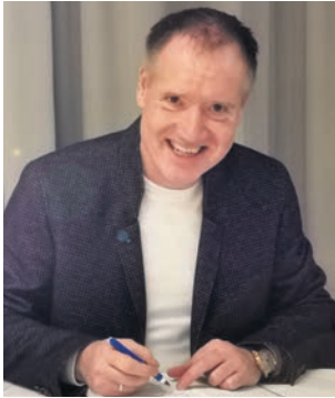
Von Michael Hauke

Anfang März wurden an den Berliner und Brandenburger Schulen die sogenannten VERA-Vergleichsarbeiten im Fach Deutsch geschrieben. Sie „untersuchen, welche Kompetenzen die Schülerinnen und Schüler einer Klasse zum Testzeitpunkt erworben haben“, heißt es dazu auf der Seite des Bildungsministeriums Brandenburg.