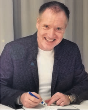
Von Michael Hauke

Als ich mit Beginn der „Pandemie“ anfang, die offiziellen Zahlen zu recherchieren, stellte sich eines von Anfang an glasklar heraus: Es war alles genau andersherum, als Politik und Mainstream-Medien unisono verkündeten. Es stimmte einfach nichts. Das waren keine Versessen, das waren berechnende Lügen, Fälschungen und Täuschungen, die täglich wiederholt wurden, so dass sie einer Gehirnwäsche gleichkamen. In jedem RKI-Wochenbericht, beim DIVI-Intensivregister, aber auch in offiziellen Studien und beim Bundesgesundheitsministerium selbst stand das Gegenteil von dem, was tagtäglich an Angstmake verbreitet wurde. Aktuell belegen das noch einmal die freigelegten RKI-Protokolle (z.B.: „Bei Corona versterben weniger Menschen als bei jeder normalen Influenzawelle!“)