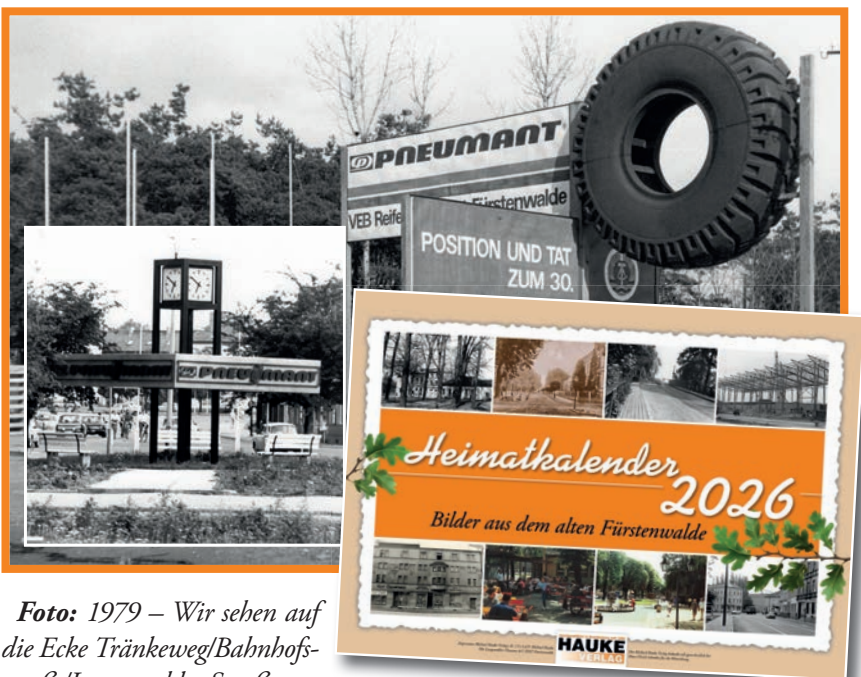
Foto: 1979 – Wir sehen auf die Ecke Tränkeweg/Bahnhofstraße/Langewahler Straße. Der Pneumant-Reifen galt als Symbol der florierenden Industrie...

Dieses Bild und viele weitere, eindrucksvolle Aufnahmen finden Sie in unserem „Heimatkalendar 2026“ mit 12 historischen Bildern aus Fürstenwalde.