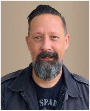
Von Jan Knaupp

Jetzt ist es wieder soweit – mit der Adventszeit hält auch das Grauen Einzug in die E-Mail Postfächer. Böartige Attacken auf Gehirn und Geldbörse sind an der Tagesordnung. Wer hier leicht beseelt ist, hat schon verloren. Nun kann man die Internetangebote ja ungelesen löschen. Wie aber geht man mit massiven Drohungen um?