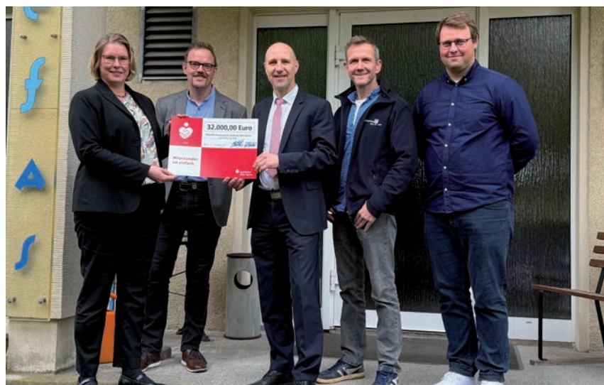
Bei der Übergabe in Erkner:

Ungeachtet dessen kommt die Sparkasse Oder-Spree ihrer Aufgabe gemäß Brandenburgischem Sparkassengesetz nach und unterstützt die Schuldnerbe-