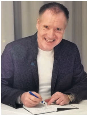
Von Michael Hauke

„In den Herzen wird's warm – still schweigt Kummer und Harm.“ Diese Zeilen aus dem deutschen Volkslied „Leise rieselt der Schnee“ werden im Advent immer wieder gesungen und immer wieder gehört. Aber wir laufen Gefahr, dass diese Zeilen zunehmend weniger zur Wirklichkeit und zur Mitmenschlichkeit gehören; und das leider nicht nur zur Weihnachtszeit.