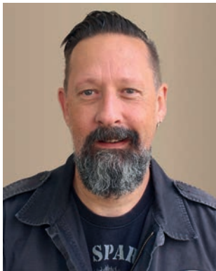
von Jan Knaupp

Ich bin immer wieder erstaunt, wie schnell sich unsere Welt und unser Leben verändert. Fühlte man sich eben noch mental im Wolkenkuckucksheim gut aufgehoben, durchquert man plötzlich kurz darauf ein mediales Jammertal und landet letztendlich in einem alltäglichen Irrenhaus. Es vergeht kaum ein Tag, an dem keine neuen Hiobsbotschaften, keine neuen Absurditäten, keine neuen Ärgernisse, keine neuen Skandale oder andere Tumulte auf uns niederprasseln. Man könnte meinen, die Menschheit ist total bescheuert geworden. Aber, dass die Menschheit schon immer plemplem war, steht wohl außer Frage. Nur dass wir jetzt die irrwitzigen Auswüchse geistiger Entgleisungen, selbstüberschätzte Egos, aktionistische Fehleinschätzungen und sogenannte Fake News geballter zu spüren bekommen. Mittlerweile verschwindet auch der letzte Hoffnungsschimmer an ein gutes Ende der Gattung Homo sapiens auf dieser Welt. Der Menschheit ist nicht zu trauen. Ich bin mir jetzt auch sicher, dass selbst Wikipedia Falschmeldungen verbreitet. Da steht doch wirklich unter der Begriffserklärung für Mensch: Homo sapiens, lat. für „verstehender, verständiger“ oder „weiser, gescheiter, kluger, vernünftiger Mensch“. Mehr Beweise für eine absichtliche Täuschung brauche ich nicht.