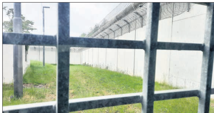
Blick aus dem Warteraum auf die äußere Gefängnismauer, die eine Krone wie die Berliner Mauer hat und zusätzlich mit zwei Rollen Nato-Draht gesichert ist. Hinter der Mauer links im Bild ist eine kleine Terrasse, auf der wir saßen.

Die Straftat trat sie am 6. Februar 2026 an. Mehr als ein Jahr liegt aktuell noch vor der Ärztin. Sie sagt mir: „Was Sie hier im Besuchsbereich sehen, hat nichts mit der Wirklichkeit in der JVA zu tun. Das kann sich keiner vorstellen, der noch nicht gegessen hat.“ Im Juli