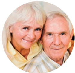
Verhinderungspflege, die Angehörige entlastet

Damit wieder jemand für Sie da ist, organisieren wir regelmäßige Spielenachmittage, feiern gemeinsame Feste, bieten geselliges Beisammensein und organisieren begleitete Restaurantbesuche.