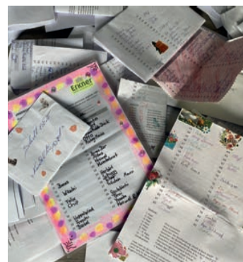
Insgesamt 340 Jagdscheine gingen im Rahmen der Kuscheltier-Jagd 2026 ein.