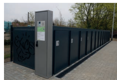
Die neuen Fahrradboxen lassen sich bequem online tages- oder wochenweise buchen

Die exakte Vorgehensweise zur Buchung und Nutzung der Schließfächer und Fahrradboxen ist an eben diesen angebracht und so jederzeit für die Nutzer ersichtlich. Die Onlinezahlung ist per PayPal, Kreditkarte, Google- und ApplePay sowie SEPA-Lastschrift (Klarna) möglich. Ist die gebuchte Mietdauer abgelaufen und wurde das Rad nicht rechtzeitig abgeholt, öffnet sich die Tür nicht automatisch. Die Box oder das Fach werden allerdings für neue Buchungen freigegeben und können von nachfolgenden Buchern geöffnet werden. Um das Ende der Mietdauer nicht zu vergessen, verschickt das Unternehmen eine entsprechende Erinnerungs-E-Mail. Während der Anmietung lässt sich die Tür beliebig oft durch den Mieter öffnen.